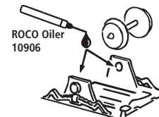
ROCO Oiler 10906

Les pièces de finition illustrées sont à monter par le modéliste. Le jeu de pièces peut comprendre d'autres pièces (non illustrées) qui sont destinées à autres versions du modèle et qui sont superflus à la variante présente.